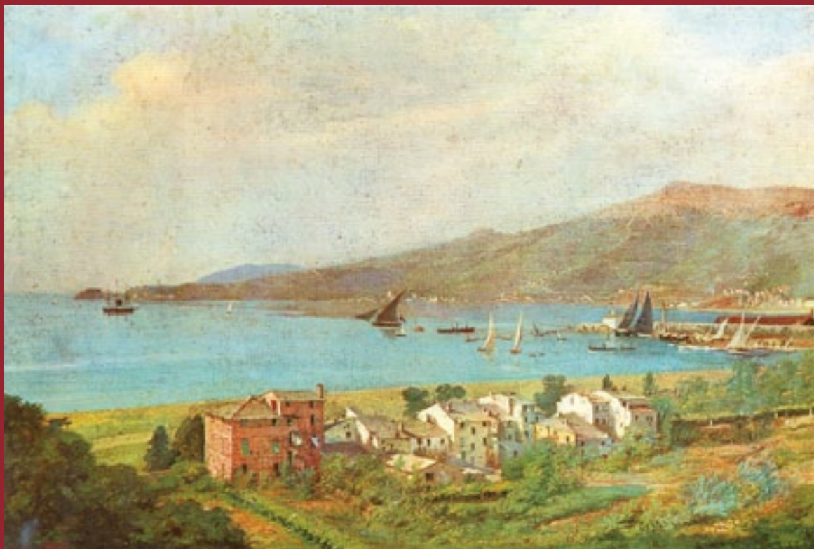
Agostino Fossati La Spezia: Panorama (Proprietà Comune della Spezia)