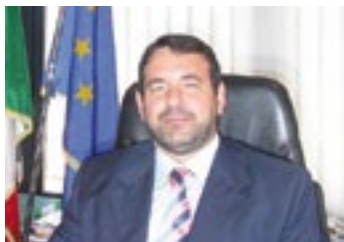
Enrico VESCO Assessore Regionale Politiche Attive del Lavoro e dell'Occupazione

Questa crisi, che ha origini fondamentalmente esterne all'economia ligure e ha caratteristiche strutturali, richiede una politica capace di coniugare gli interventi per sostenere i redditi e le attività produttive con la definizione nuove scelte economiche. Alla fine del 2010 la Regione Liguria ha avviato, con un investimento complessivo di oltre 122 milioni di euro (derivante da fondi regionali, fondi statali e fondi europei), un Piano Straordinario per il Lavoro finalizzato a sostenere l'occupazione e a contrastare la crisi economica in atto.